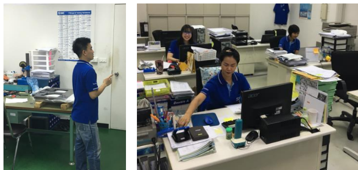
活気あふれるタイ現地法人の事務所

東亜精機工業がタイに現地法人を開設して、今年で早や5年目となりました。タイに集積する日系メーカー様への治具提案・供給サービスを目的に立ち上げた現地法人・工場です。お蔭をもちまして現在では軌道にのり、タイでも日本同等の品質・サービスレベルを実現しています。タイもしくはASEANでも、治具のことならぜひ東亜精機工業にお声かけください！