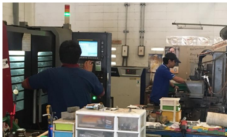
日本と同じ品質を実現！（現地工場の様子）